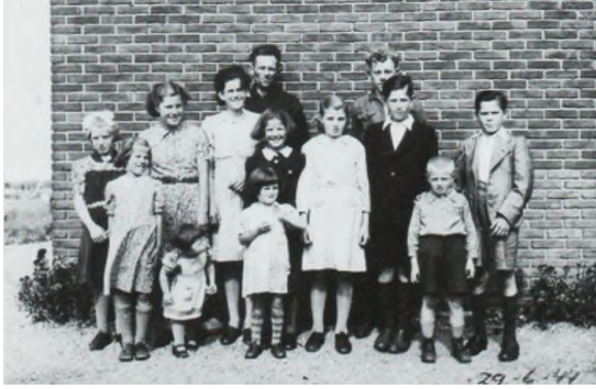
De (bijna) voltallige familie op 29 juni 1944, samen met enkele neven en nichten (Moeder en Miet waren afwezig; zij waren bidden voor de vrede)

Bij het opperbevel onder leiding van Eisenhower en Montgomery was het stoutmoedige plan bedacht om met een soort bliksemanval enerzijds de vijand via de Duitse hoogvlakte in haar kern aan te vallen en anderzijds het nog in Nederland aanwezige bezettingsleger de pas af te snijden. Dit alles zou geschieden onder de codenaam: "Market-Garden".