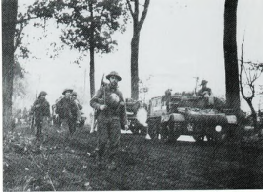
De Schotten rukken op naar Neerkant en Meijel

Ondanks dat deze schuilgelegenheid als Rode Kruispost enige bescherming genoot waren de burgers voor menige Duitser een doorn in het oog. Regelmatig werden pogingen gedaan om hen daar weg te krijgen. Zo gebeurde het dat iedereen uit huis werd gehaald en op 'n rij voor het huis werd neergezet, met daarbij een soldaat met het geweer in de aanslag.