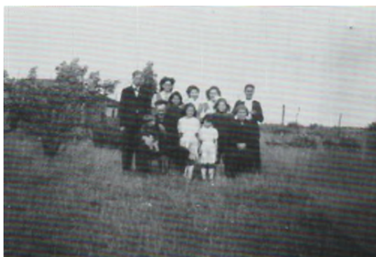
1948: Samen achter de barak op d'n dries

harmonica te spelen. Omdat dat vaak tot diep in de nacht gebeurde moest er 's morgens wel 'ns slaap ingehaald worden.