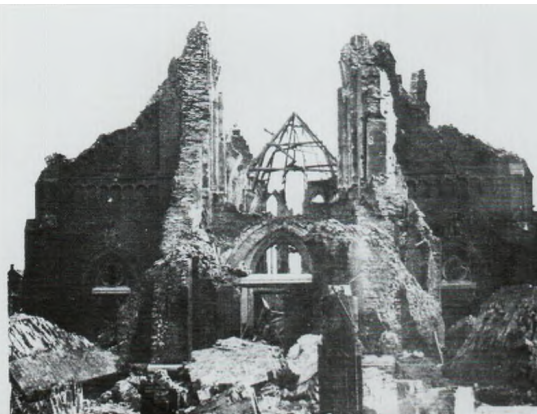
Wat overbleef van de eens zo fraaie Meijelse Kerk

De volgende morgen, het was inmiddels maandag 25 September werd de gehele omgeving opgeschrikt door een aantal enorme knallen gepaard gaande met grote stofwolken boven het centrum van Meijel. De "kathedraal van de Peel" waaraan door de Meijelse bevolking jarenlang was gewerkt was gereduceerd tot een rokende puinhoop. Duitse barbaren hadden deze prachtige kerk opgeblazen, zogenaamd voor "weg-versperring". Een zinloze daad van doelloze mensen.