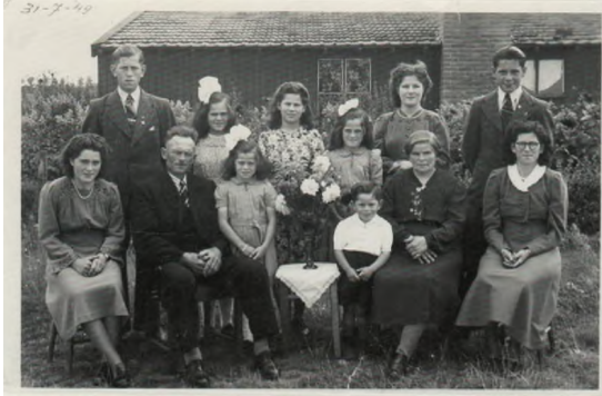
Een schôn, grote familie (1949)