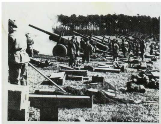
Massale beschietingen vanuit Asten op Meijel en Neerkant

De gehele nacht hebben de Tommy's hun kanonnen gericht op dit weerloze dorp, duizenden granaten werden losgelaten, met alle gevolgen van dien. Toen het tegen de morgen weer rustig werd is Vader weer door sloten en greppels, zoals hij dat ook al eerder deed, naar het dorp gegaan, voor het halen van wat levensmiddelen. Wat hij daar zag is nadien nog vaak door hem verteld. Er was geen enkel huis onbeschadigd, vele lagen in puin, bijna niemand van de eigen bevolking was te bespeuren.