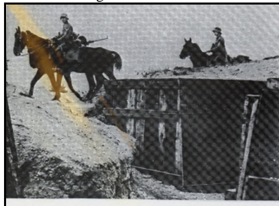
Duitse militairen passeren de Peel Raamstelling