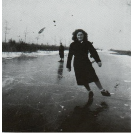
Winter 1948: An zwiert over het Deurnesch Kanaal