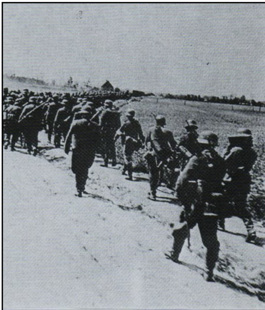
Duitse militairen op weg naar de overwinning

Diegenen onder U die het persoonlijk hebben beleefd dan wel op een andere wijze er kennis van hebben genomen weten dat er uiteindelijk bij de Peel Raamstelling, en zeker in het Peelgedeelte, nauwelijks gevechten zijn geleverd. Door een list, waarbij nabij Mill een Duitse pantser trein was doorgebroken dreigden onze verdedigers in de rug aangevallen te worden. Men trok zich schielijk terug achter de volgende Linie, de Zuid-Willemsvaart, waar daarentegen hier en daar wel flink werd gevochten, totdat ons land zich na de hevige bombardementen op ondermeer Rotterdam op 15 Mei 1940 noodgedwongen moest overgeven. De capitulatie was een feit.