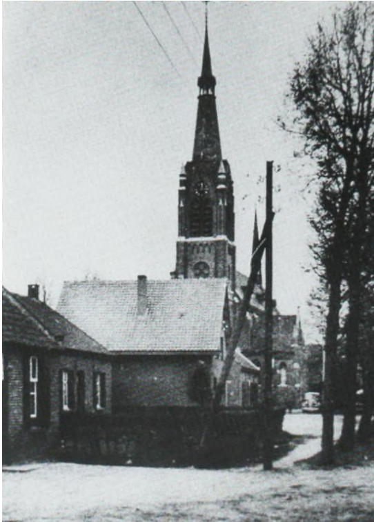
De fraaie Neerkantse kerk vóór haar verwoesting op 28 okt.1944

In Liessel lagen in die dagen ongeveer 240 doden begraven, waarvan ongeveer de helft Duitsers. Ook de burgerij had zware verliezen. In totaal waren er 32 doden te betreuren. Dit aantal bedroeg in de Neerkant 11.