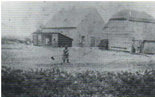
De eerste boerderij (1939) Moeder is aan het hakken

Toch zaten er ook wel leuke en positieve kanten aan. De kinderen keken hun ogen uit en waren dan ook niet bij de soldaten weg te slaan.