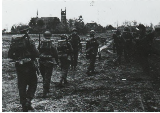
De geallieerden rukken op naar het centrum van Neerkant nov.1944 (nabij de tuinbouwloods i.d. Moostenstraat)

Maar,... een zware vlucht naar echt bevrijd gebied zou nog moeten volgen. Omdat de vijand nog in de nabije omgeving verkeerde, geheel Meijel was immers nog bezet, vonden de Tommy's het raadzaam deze burgers naar veiligere oorden over te brengen, alleen er was totaal geen vervoer beschikbaar.